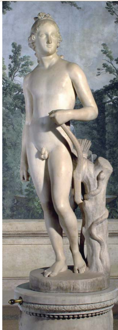
Gincinnato Baruzzi, Apollo, Collezioni Comunali d'Arte

La funzione museografica e di salvaguardia del patrimonio assoluta dalla Biblioteca. L'azione parallela e congiunta della Deputazione di Storia Patria. Dall'accantonamento delle raccolte artistiche, bibliografiche e documentarie in un'unica sede alla segmentazione in istituti diversi. Ricostruzione delle vicende conservative delle raccolte prima del Museo Civico, attraverso lo studio delle fonti inventariati.